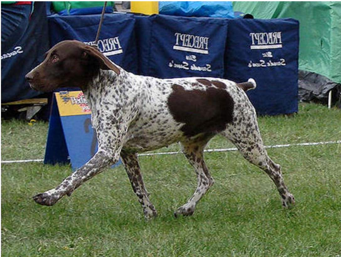
Tik med utmärkta, vägvinnande rörelser

Rörelserna skall vara raka och parallella såväl fram som bak. Rasen skall ha god resning i rörelse.