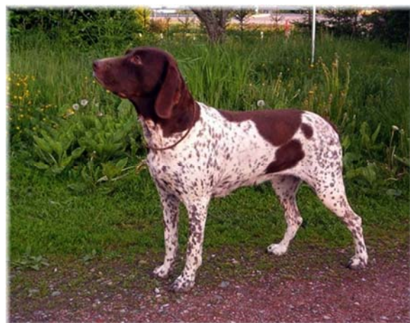
Tik av utmärkt typ.