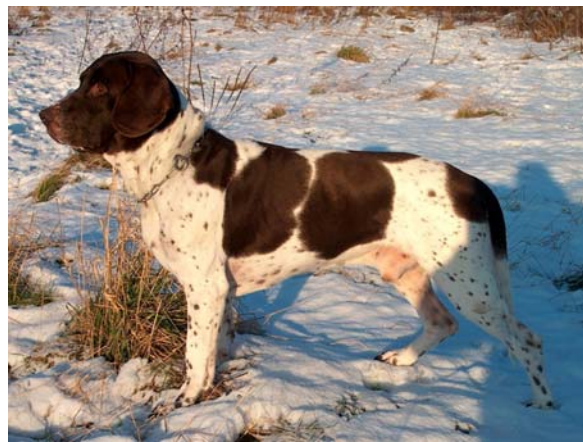
Hanhund av utmärkt typ.

Förhållandet mellan mankhöjd och kroppslängd skall vara 8:9.