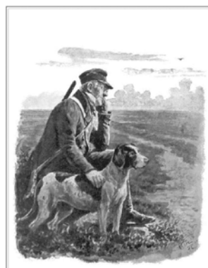
Sten Stensen Blicher (se mer info på sidan 12)