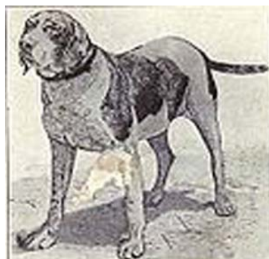
Spansk pointer, som tros vara en del av bakgrunden till GDH (Lägg märke till likheten)

Förmågan att stå för fågel har de sedan ärvt från de spanska pointerarna. Vidare skulle (och skall) GDH'n kunna använda sin utmärkta näsa även vid annan typ jakt än endast fågeljakt.