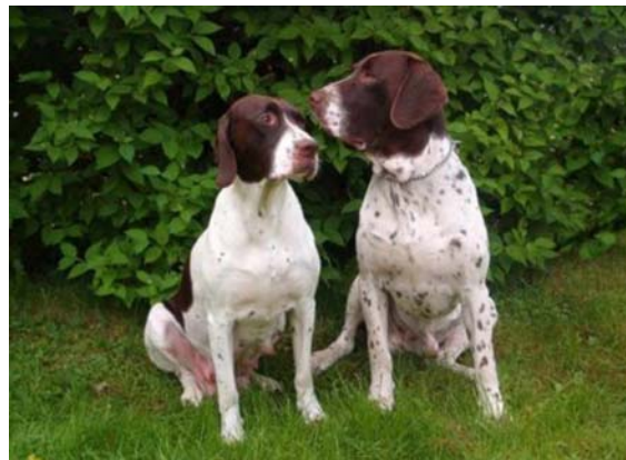
Tik och hane som visar tydlig könsprägel.

Medan hanhunden är kraftfull och tung, är tiken lättare, livligare och mer temperamentsfull.