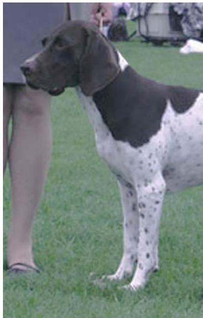
Tik med utmärkt front och nacke.

Kommentar: Det finns en liten tendens att hundarna blir för grova och tunnformade i sin bröstkorg. En för djup och bred bröstkorg hindrar hunden under jakt. Det ser kanske imponerande ut, men är inget som skall premieras.