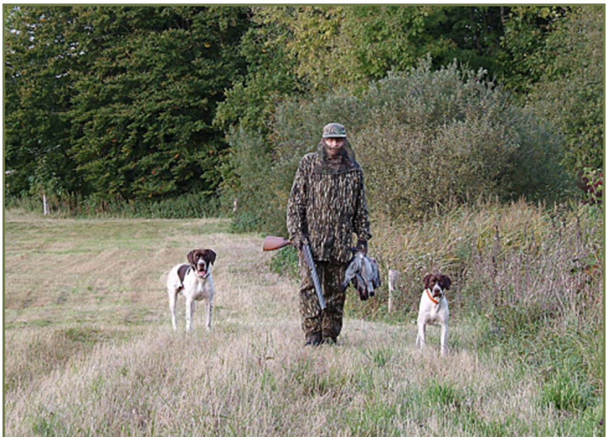
En gammel dansk hönsehund är, och skall fortsatt vara, en jakthund

Hos hanhund måste båda testiklarna vara fullt utvecklade och normalt belägna i pungen.