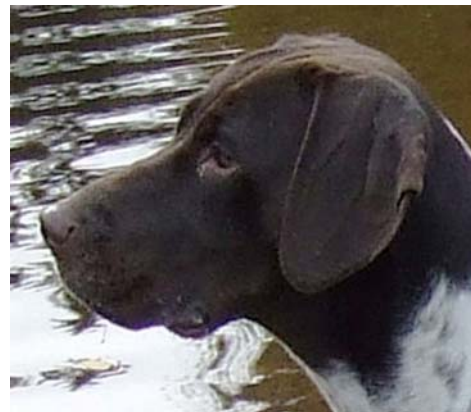
Utmärkt tikhuvud med korrekta proportioner.