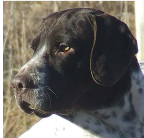
Utmärkt hanhundshuvud med korrekta proportioner.

Kommentar: Här skiljer det en del mellan hane och tik. En tik skall ha betydligt mindre löst skinn och ett stramare utseende varför lösa ögonkanter bedöms hårdare.