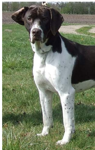
Exempel på hane med rak överarm och framskjuten skuldra

Framtassarna skall vara starka, slutna och väl välvda. Trampdynorna skall vara hårda.