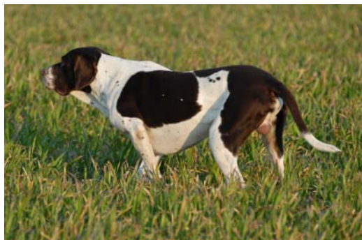
Lägg särskilt märke till halsskinnet på denna hane.

Den arbetar i god kontakt med föraren och löser sin uppgift som stående fågelhund utan att skapa onödig oro i terrängen. Den är lika användbar på stora som små jaktmarker.