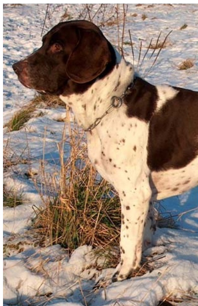
Hanhund med väl musklad hals, välvinklat framställ och god manke.

Ett väl utvecklat förbröst är mycket önskvärt.