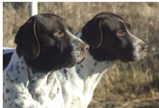
Utmärkta öron och ögonkanter, en aning ljusa ögon.

Öronen skall vara tämligen lågt ansatta, breda och lätt avrundade i nederkanten. Längden är korrekt om öronen, när de förs framåt, lämnar den yttersta tredjedelen av nospartiet fri. Öronens främre kant skall falla mjukt intill kinderna.