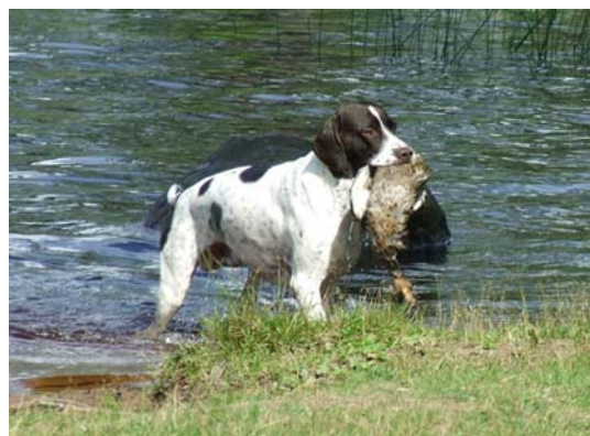
Olika jaktsituationer med gammel dansk hönsehund.